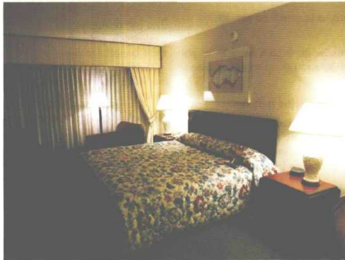
Hotel sprawdzi się doskonale jako firma społeczna, ponieważ oferuje dużą różnorodność stanowisk pracy, które można dostosować do zawodowych potrzeb i predyspozycji beneficjentów.

■ w odpowiedzi na potrzeby pracownika są wprowadzane racjonalne zmiany,