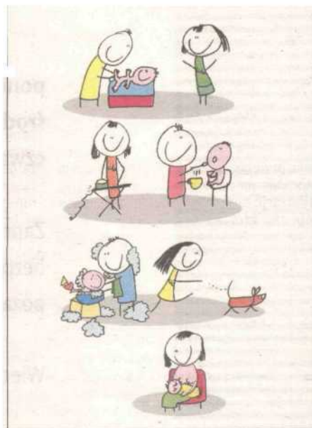
„Razem wychowujemy dziecko”, rys. Andrzej Tylkowski/Wydawnictwo Ilustris

Informacje o tych miejscach są regularnie umieszczane na stronach wortalu www.pracujacyrodzice.pl . Mamy nadzieję, że dzięki temu stworzona zostanie mapa miejsc (instytucji, kawiarni etc.) ułatwiających rozwój osobisty rodziców a zarazem bezpiecznych oraz przyjaznych dla dzieci.