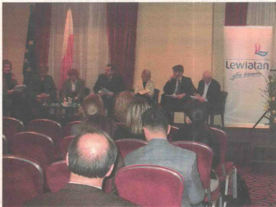
Konferencja Rynek Pracy 2007

Oferta Projektu adresowana do firm skierowana jest do przedstawicieli biznesu wszystkich sektorów i branż, głównie kadry zarządzającej oraz specjalistów ds. zarządzania zasobami ludzkimi. Udział w Projekcie jest bezpłatny.