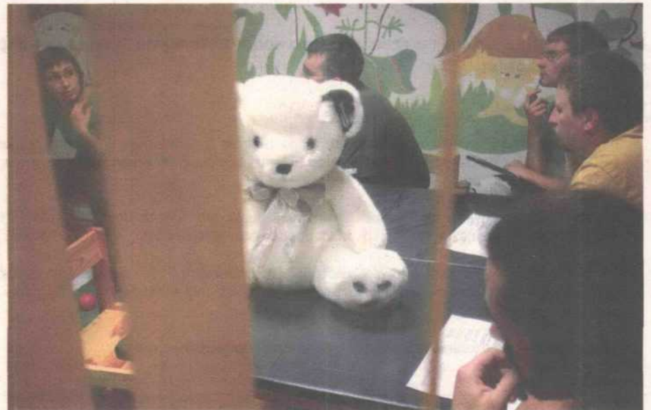
Warsztaty dla taty

W ramach realizacji Projektu podjęliśmy współpracę z kilkoma miejscami wyróżnionymi tytułem MIEJSCA PRZYJAZNE MALUCHOM. Pomysłodawcą akcji jest agencja PR INSPIRATION, a patronuje jej Gazeta Wyborcza. Celem akcji jest wyróżnienie miejsc, w których pojawienie się rodziców z małymi dziećmi nie stwarza dla nikogo problemu, miejsc, w których rodzice z małymi dziećmi będą zawsze mile widziani, w których dzieci mogą czuć się dobrze. Ważne stają się zatem m.in. wyposażenie miejsca w przestrzeń dla dzieci (stolik z zabawkami, krzeselka, miejsce do przewijania niemowląt, przybory plastyczne, książeczki, plac zabaw), dziecięce menu, dodatkowe działania animacyjne dla dzieci (warsztaty, zabawy, pogadanki dla dzieci), wyodrębnione miejsce dla niepalących. Projekt Przyjazny Rodzicom podejmuje liczne działania zmierzające do promocji miejsc, które zyskały miano Miejsc Przyjaznych Maluchom.