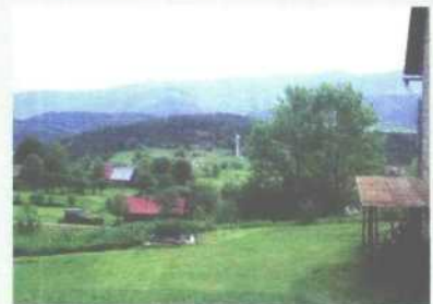
Firma „Green Traveller” oferuje turystom m.in. wycieczki Szlakiem Zbójców.

Podobny cel przyświeca działalności „Green Traveller”, przedsiębiorstwa społecznego, założonego przez Babio-górskie Stowarzyszenie Zielona Linia. Siedmioro młodych pracowników, pod