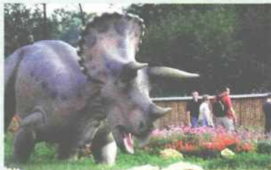
Dinozaury to pomysł zatrudniającej 8 osób spółki Allozaur na przyciągnięcie turystów.

Spółka Allozaur z Bałtowa w woj. świętokrzyskim powstała dzięki determinacji Stowarzyszenia na rzecz Rozwoju Gminy Bałtów „Bałt”, które uznało, że inwestowanie w turystykę wydobędzie ich wieś z biedy i marazmu. Podstawy do takiego myślenia były solidne, bo okolica obfituje w bogactwa przyrody i kultury. Obecnie Allozaur zatrudnia 8 osób, ale już wkrótce liczba ta wzrośnie do 13. W ciągu trzech lat zbudowano Bałtowski Park Jurajski, a już w 2003 r. ruszył spływ tra-