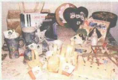
Firma Horyzonty ITD opracowała wiele materiałów reklamujących Lanckoronę wśród turystów.