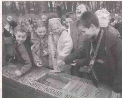
Dzieci poprawiały kamień węgielny

Wzorem dla krakowskiego ogrodu jest park działający w Norymberdze. Na sześciu hektarach prezentowane będą urządzenia pokazujące prawa fizyki, związane m.in. z: oddziaływaniem siły (huśtawki, elementy ukazujące działanie siły gra-