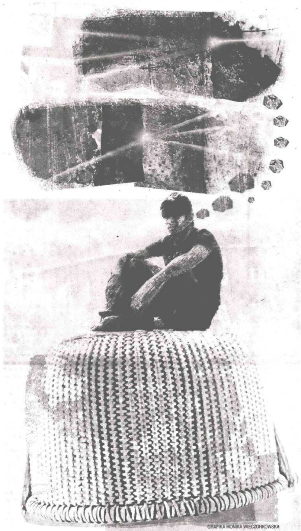
GRAFIKA MONIKA WIECZORKOWSKA