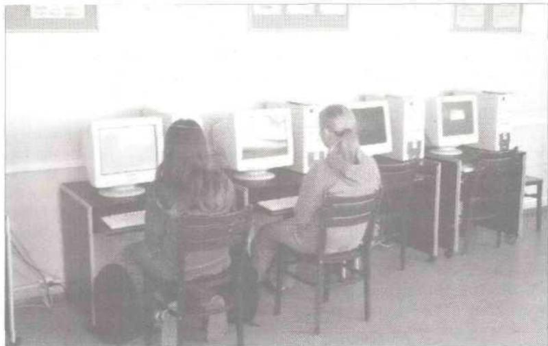
W pracowni komputerowej.