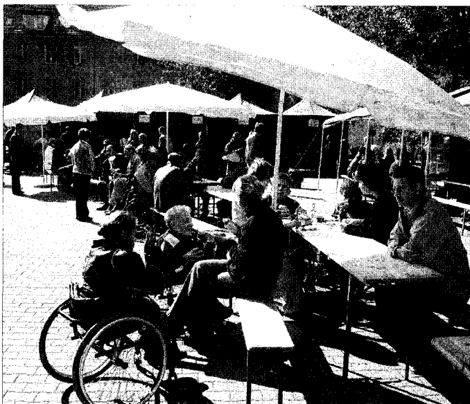
Z warsztatów skorzystało ponad 200 osób – osoby niepełnosprawne miały okazję zawrzeć nowe, cenne znajomości.