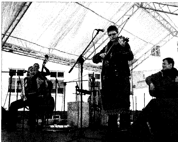
Koncert zespołu „Dikanda” to podróż przez muzykę różnych regionów świata.

Kampania społeczna Projektu „Telepraca szansą na zwalczanie nierówności i dyskryminacji na rynku pracy” Administratorem Projektu jest Zachodniopomorska Szkoła Biznesu w Szczecinie Projekt jest realizowany przy udziale środków Europejskiego Funduszu Społecznego w ramach Inicjatywy Wspólnotowej EQUAL