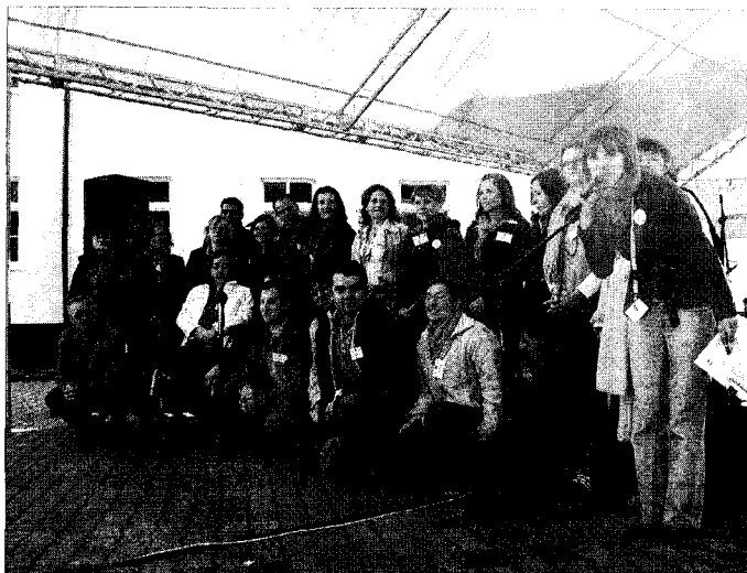
Warsztaty były okazją do osobistego poznania wszystkich pracowników biura oraz partnerów projektu.

ZA nami wakacyjne warsztaty dla osób niepełnosprawnych ruchowo, organizowane w ramach projektu „Telepraca szansą na zwalczenie nierówności i dyskryminacji na rynku pracy”. Ostatnie spotkanie było prawdziwym świętem idei zatrudniania osób, które do tej pory często skazane były na vegetację na zasiłku.