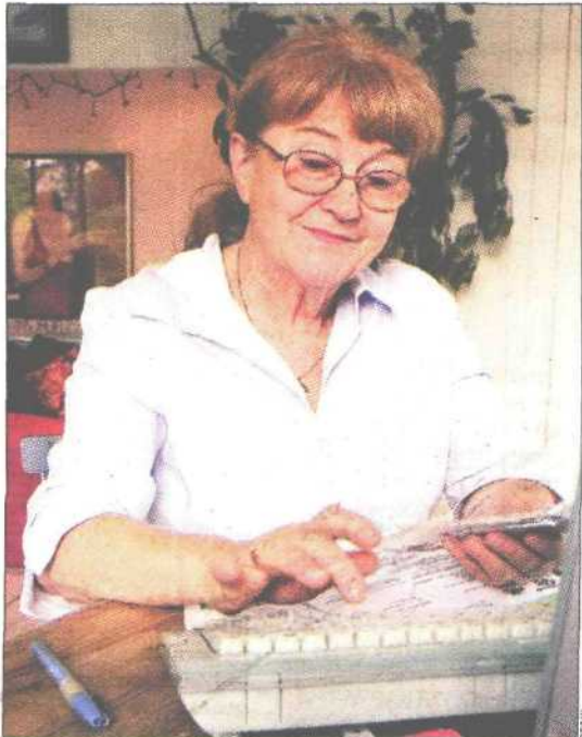
E-learning to antidotum na samotność