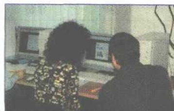
Szkolenie w COPIK

— Wraz z Olsztyńską Izbą Budowlaną, stowarzyszeniem branżowym, podjęliśmy działania na rzecz wzmocnienia lokalnych przedsiębiorstw i rozwoju kadr budowlanych