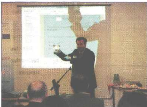
Konferencja inauguracyjna projektu

EQUAL. Warmińsko-Mazurski Zakład Doskonalenia Zawodowego razem z Olsztyńską Izbą Budowlaną, Polską Korporacją Techniki Sanitarnej Grzewczej Gazowej i Klimatyzacji i Agencją Nieruchomości Rolnych, zawiązał Partnerstwo realizujące projekt „Budujmy Razem”. Za główny cel projektu obrano wzmocnienie sektora budowlanego i instalatorskiego. Ma to nastąpić dzięki rozwojowi kadr, a także wprowadzeniu do sektora nowoczesnych technologii zarówno z zakresu informatyki, jak i ekologii. Dzięki programowi EQUAL utworzone zostało lokalne „konsorcjum organizacji” działających na rzecz przedsiębiorców z sektora budowlanego i instalatorskiego.