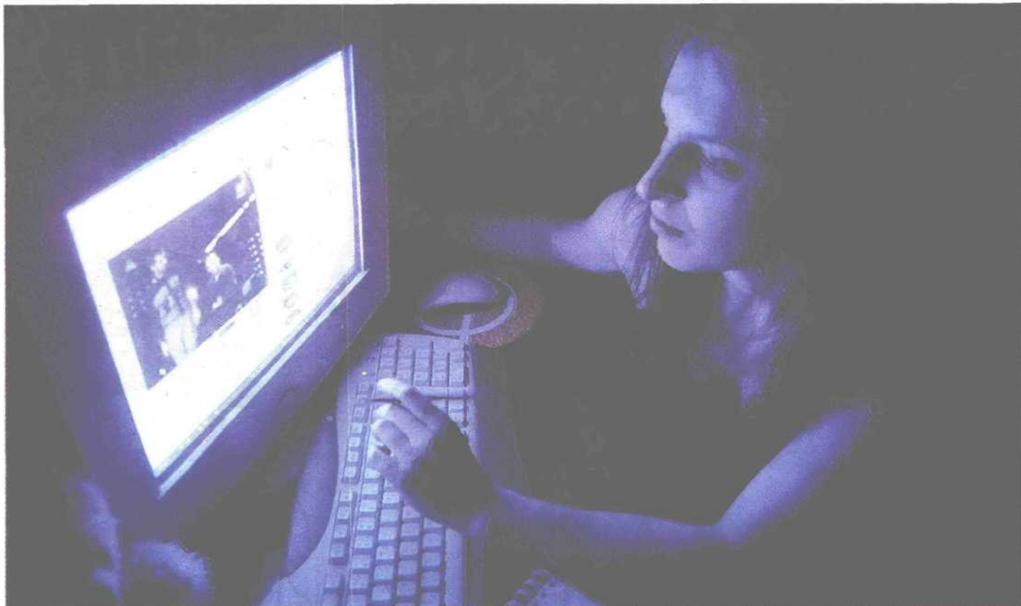
WE WŁASNYM BIURZE Na razie w Polsce praca na odległość nie jest jeszcze zbyt popularna.