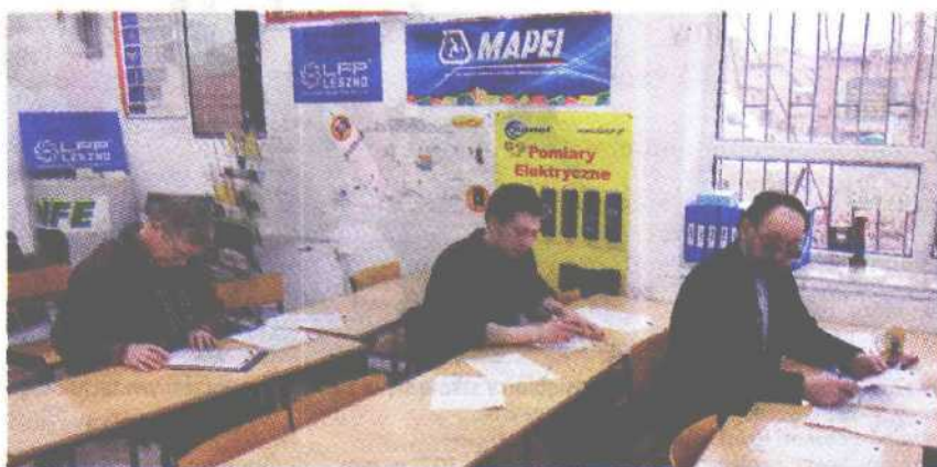
Umiejętności zostają sprawdzane najpierw podczas testu teoretycznego...

zaaranżowanych (symulujących rzeczywiste), po samodzielnym dobraniu materiałów i narzędzi, uczestnik wykonuje odpowiednie zadania. Ta część pokazuje, kto naprawdę zna się na rzeczy. Uczestnik cały czas jest kontrolowany czy pracę wykonuje samodzielnie. Na podstawie wyników z poziomu teoretycznego i praktycznego komisja kwalifikacyjna podejmuje decyzję o zatwier-