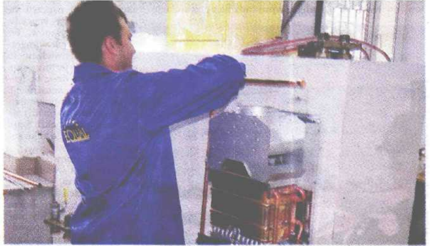
...a następnie w praktyce — montaż instalacji gazowych